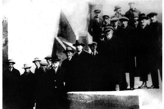
Академік Є.В. Оппоков і майбутній президент АН УРСР О.В. Паладін з науковою делегацією ВУАН в Донбасі, 1930-ті роки, Артемівськ

ми Німеччини, сприяли гарній обізнаності Оппокова про роботи, які виконувалися як всередині, так і за межами Росії. Він не тільки творчо використовував ці знання у власній науковій і практичній діяльності, але доводив їх до відома широкого кола фахівців країни, систематично публікуючи реферати окремих робіт, огляди досліджень з даної проблеми, опису методів виконання робіт, машин і приладів. Цьому, зокрема, сприяла діяльність Оппокова в якості редактора відділу гідротехніки Технічної енциклопедії та публікація у ній великої кількості статей.